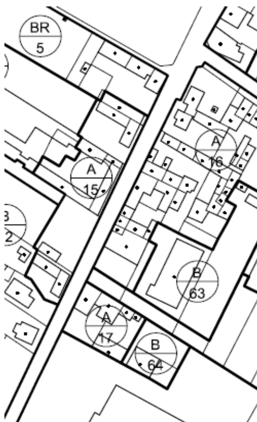
estratto P.R.G.: TAV. 13.3.31