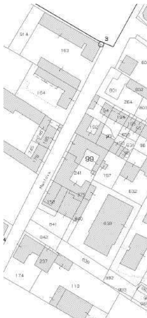
Estratto catastale: foglio 31

Le aree di sedime degli attuali marciapiedi sono classificate nel vigente P.R.G. parte in z.t.o. "A" - centro storico e parte in z.t.o. "BR" - ristrutturazione; catastalmente non risultano di proprietà comunale ma sono ad uso pubblico da tempo immemorabile (oltre 20 anni) come altre strade.