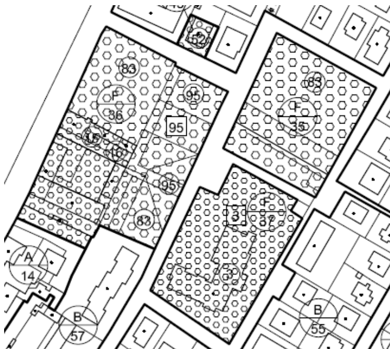
estratto P.R.G.: TAV. 13.3.31