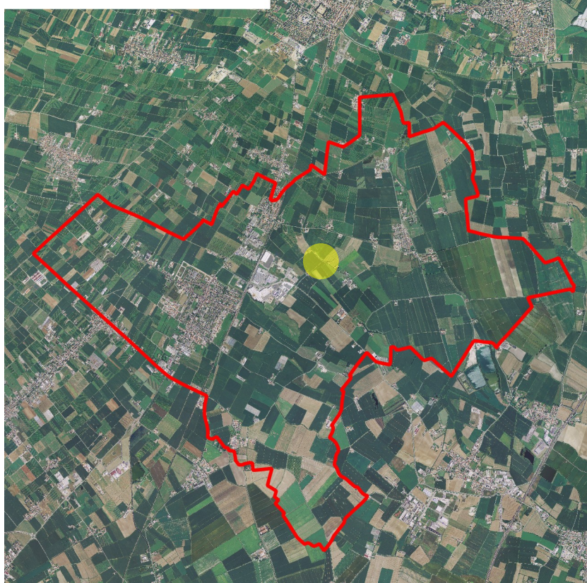
Individuazione degli edifici all'interno del territorio comunale